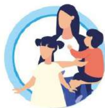
У ДЕТЕЙ ДО 5 ЛЕТ