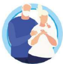
У ПОЖИЛЫХ ЛЮДЕЙ СТАРШЕ 65 ЛЕТ

РИСК ТЯЖЕЛОГО ТЕЧЕНИЯ ГРИППА И ОРВИ ЗНАЧИТЕЛЬНО ВЫШЕ: