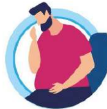
У ЛИЦ, ИМЕЮЩИХ ХРОНИЧЕСКИЕ ЗАБОЛЕВАНИЯ