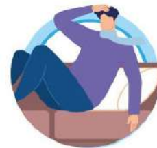
У ЛИЦ С ОСЛАБЛЕННОЙ ИММУННОЙ СИСТЕМОЙ