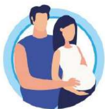
У БЕРЕМЕННЫХ ЖЕНЩИН